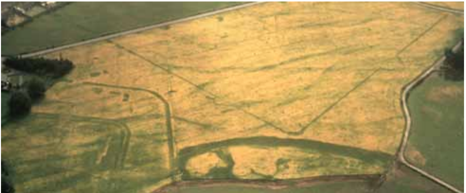
Faodaidh gun tug treabhadh fad ùineachan lorg làraichean air falbh bhon uachdar. Ach, faodaidh cuid de shuidheachaidhean fàgail mar thoradh gum faodar làraichean fhaicinn bhon adhar (air a bheil comharraidhean-bàirr). Tha an comharraidh-bàirr seo a' sealltainn dìgean ann an campa Ròmanach (sa mheadhan) agus daingneach Ròmanach (dì aig a' bhonn) ann an Dalginross, Peairt is Cinn Rois.

Tha cuid de làraichean is de charraighean àrsaidh – leithid tursachan bhon àm ron eachdraidh, tobhtaichean de chaistean agus iarmaid-airm bhon 20mh Linn – follaiseach an-diugh. Tha cuid eile nach eil cho follaiseach seach nach do dh'fhàg iad lorg air an uachdar, a thathar a' dìon air sàilleabh fianais cudromach a tha ga gleidheadh fon talamh.