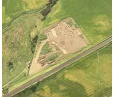
Cladhachadh iathaidh le bacan bhon àm ron eachdraidh aig Dryburn Bridge, Lodainn an Ear, air fhaicinn bhon adhar. Faodaidh làraichean a mhaireas fon ùir a bhith cugallach a thaobh atharrachaidhean air cleachdadh-fearainn.

Tha sealbhadairean, luchd-còmhnaidhe is manadsairean gu math bunaiteach gus a dhèanamh cinnteach gum mair carraighean clàraichte. Cuidichidh do chuid taice gus an làrach cudromach seo a ghleidheadh gu mòr ri Alba san àm air thoiseach.