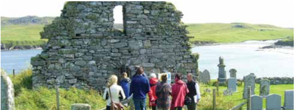
St Olaf's Church, Unst, Sealtainn. Cha bhi clàradh ag atharrachadh nan ullachaidhean farsaing mu chothrom poblach air fearann sa Chòd Albannach mu Chothrom A-muigh (faicibh www.outdooraccess-scotland.com ).

Cha toir clàradh còir sam bith a bharrachd air cothrom poblach agus cha bu chòir gun cuir e ri àireamh an luchd-tadhail. Cha bhi Alba Aosmhor ag adhartachadh cothrom air carraighean clàraichte ann an sealbh prìobhaideach.