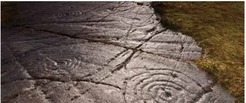
Eisimpleir de shmaigheadh ann an creagan bhon àm ron eachdraidh, air a dhèanamh suas air a' chuid as motha de chomharraidhean chuachan is fhàinneachan, air garbhach faisg air Achadh nam Breac, Earra-Chhàidheal is Bòd.

Tha Alba Aosmhor cuideachd a' nochdadh a cuid fiosrachaidh air PASTMAP ( www.pastmap.org.uk ), làrach-lìn a chaidh a chur ri chèile còmhla ris a' Choimisean Rìoghail air Carraighean Àrsaidh is Eachdraidheil na h-Alba, far am faod sibh rannsachadh airson fiosrachaidh air àrainneachd eachdraidheil na h-Alba à iomadh àite.