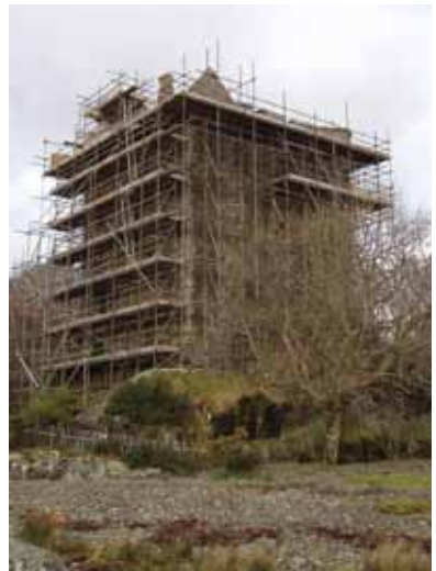
Airson obair a chuireas ri cor carraighean no a seasmhachd. © Còraichean a' Chrìin: Alba Aosmhor.

Bidh na h-Oifigearan Sgìreil againn a' tadhal air làraichean clàraichte is air sealbhadairean bho àm gu àm. Bidh iad a' toirt sùil air cor na làraich, a' tairgse comhairle mu riaghladh charraighean is a' dèanamh cinnteach gum bi fios aig a h-uile duine le ùidh san làraich an-dràsta gu bheil inbhe air a dìon aice.