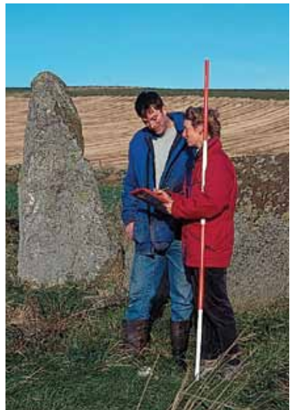
Bidh Alba Aosmhor a’ brosnachadh deasbairteachd aig ìre thràth mu obraichean a thathar a’ moladh. © Còraichean a’ Chrùin: Alba Aosmhor.

’S fheàrr ur cuid mholaidhean a dheasbad le Alba Aosmhor (Oifigear-rianachd Dualchais na sgìre agaibh) mus cuir sibh a-steach iarrrtas airson cead. Cha bhi Alba Aosmhor a’ cur cìse airson iarrrtasan no comhairle. Tha na h-Oifigearan-rianachd Dualchais againn toilichte comhairle a thairgse mu mholaidhean aig ìre thràth. Faodaidh gun cuir seo air chomas gun tèid cead a thoirt nas luaithe. Tha obraichean sam bith air carragh chlàraichte feumach air cead bhon t-sealbhadair is bhon neach-chòmhnaidhe, a bharrachd air CCC. Mura buin am fearann dhuibh fhèin, feumaidh sibh fios a chur dhan t-sealbhadair gu bheil sibh ag iarraidh cead fhaighinn.