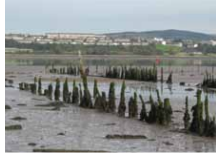
Lochain-fhiodha bhon 19mh linn air bruach inbhir Chluaidh. Ged as ann air an talamh a tha a' chuid as motha de na carraighean clàraichte, tha cuid nan laighe air a' chladach no fon mhuir © Còraichean a' Chrùin: Alba Aosmhor.

Tha na carraighean clàraichte as aosta a' dol air ais 8,000 bliadhna, nuair a thuinich daoine ann an Alba an toiseach. Air an fheadhainn as ùire tha àiteachan-ghunnaichean agus àiteachan-dìona an aghaidh ionnsaighean bhon Dara Cogadh. Eadar an dà cheann, tha raon mòr de charraighean den a h-uile seòrsa, bho dhùintean-adhlacaidh bhon àm ron eachdraidh gu daingnichean Ròmanach, gu clachan snaighte bho àm na Crìosdalachd gu muilnean-gnìomhachais. Tha còrr is 8,000 de charraighean clàraichte sgapte air feadh na h-Alba.