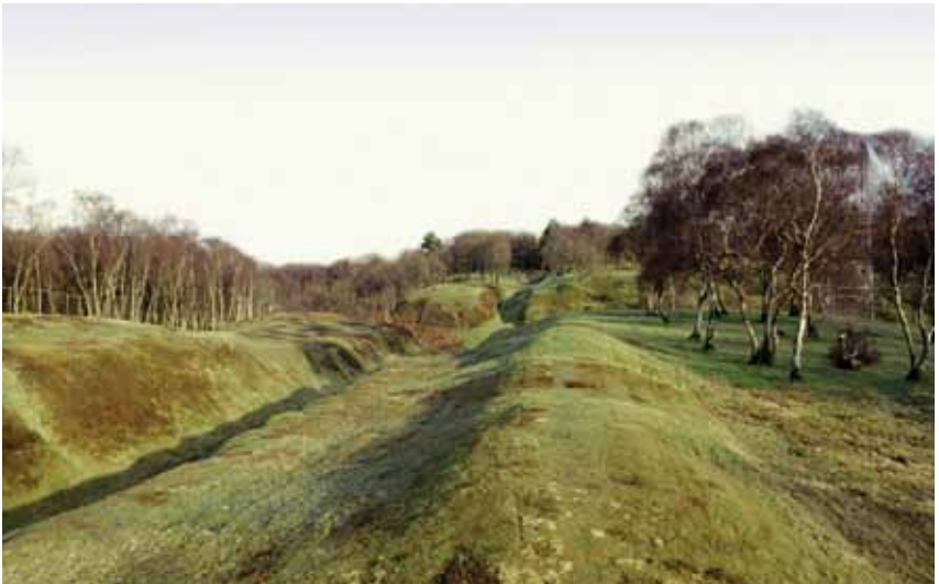
Earrann de ghàrradh-fòid na sheasamh air Balla Antonine nan Ròmanach, mar chuid de Làrach Dualchas na Cruinne a-nis. Ann am mòran shuidheachaidhean, bidh an àrainn chudromach, agus an ìre chlàraichte a rèir sin, a' leudachadh thairis - aig amannan fada thairis - air an shuidheall a ghabhas faicinn.

Tha barrachd fiosrachaidh ann am Poileasaidh na h-Alba mun Àrainneachd Eachdraidheil mu dhìon togalaichean is carraighean cudromach na h-Alba. Tha e a' leagail sìos nan slatan-tomhais gus obrachadh a-mach a bheil cuideam nàiseanta air carragh.