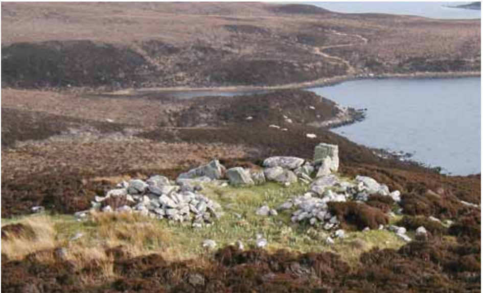
Cha leig carraighean àrsaidh leas a bhith air am maiseachadh no drùidhteach gus a bhith cudromach. Tha an làrach seo aig Stiarabhal sna h-Eileanan Siar air a dèanamh suas de bharpa Neolithic ann an Imse Gall cho math ri àirighean fad an dèidh sin. Tha de chomas aig an làrach fiosrachadh cudromach a thoirt mu chleachdaidhean-tiodhlacaidh san àm ron eachdraidh agus mu chleachdaidhean-àiteachais nas giorra air ais.

Bidh Alba Aosmhor a' meas charraighean airson clàraidh a rèir stiùiridh is slatan-tomhais a shocraicheas ministearan na h-Alba. Bidh seo a' cur farsaingeachd mhòr de nithean san àireamh, nam measg cùisean ealain, arc-eòlais, ailtireach, eachdraidheil, dùthchasach, bòidhchead, saidheansail is sòisealta.