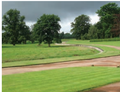
Fearann pàirce aig Mertoun, Crìochan na h-Alba

Chaidh Cunntas Ghàraidhean is Sheallaidhean-tìre Dealbhaichte ann an Alba fhoillseachadh airson a' chiad