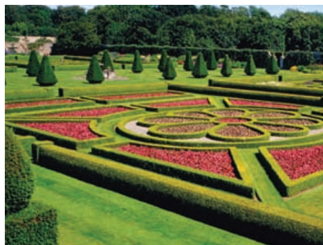
An gàradh balla foirmeil aig Pitmedden, Siorrachd Obar Dheathain

uair ann an còig irisean ann an 1987, le trì irisean roinneil a bharrachd gam foillseachadh eadar 2001 is 2005. Bha na foillseachaidhean as ùire a' toirt a-steach gach cuid làraichean nach robh cho ainmeil, agus raon nas fharsainge de sheòrsa sheallaidhean-tìre dealbhaichte, leithid pàircean poblach is cladhan.