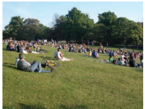
Pàirce Kelvingrove, Glaschu

ion-mhiannaichte atharrachaidhean a dhèanamh. Mar eisimpleir, bidh riaghladh seasmhach fearann-coillteach mar as trice a' toirt a-steach ìrean de thanachadh agus gearraidh a bharrachd air ath-shuidheachadh. Is ann air an t-sealbhadair/neach-còmhnaidh a tha an dleastanas a thaobh riaghladh làitheil agus cumail suas gàradh no sealladh-tìre dealbhaichte a tha sa Chunntas. Ged nach eil a na riatanas Alba Aosmhor no an t-ùghdarras ionadail a thoirt an sàs sa ghnòthach a thaobh raointean planntachaidh ùra msaa, tha sinn an-còmhnaidh deònach comhairle is stiùireadh a thoirt seachad.