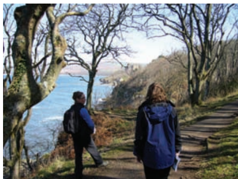
Cuairt oirthir aig Caisteal Culzean, Siorrachd Air a-Deas