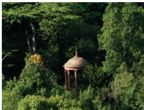
Teampall Muses am measg chraobhan, Abaid Dryburgh, Cricochan na h-Alba

Bidh Alba Aosmhor, buidheann gnìomh de Rìghaltas na h-Alba, a' tional Cunntas de Ghàraidhean is Sheallaidhean-tìre Dealbhaichte ann an Alba às leth Mhinistearan na h-Alba. Tha an Cunntas a' toirt aithne do làraichean nàiseanta cudromach agus a' stiùireadh riaghladh nan atharrachaidhean a tha a' toirt buaidh orra le bhith a' dèanamh cinnteach gu bheil a' phròiseas dealbhaidh a' gabhail suim de chudromas an t-suidheachaidh seo den àrainneachd eachdraidheil.