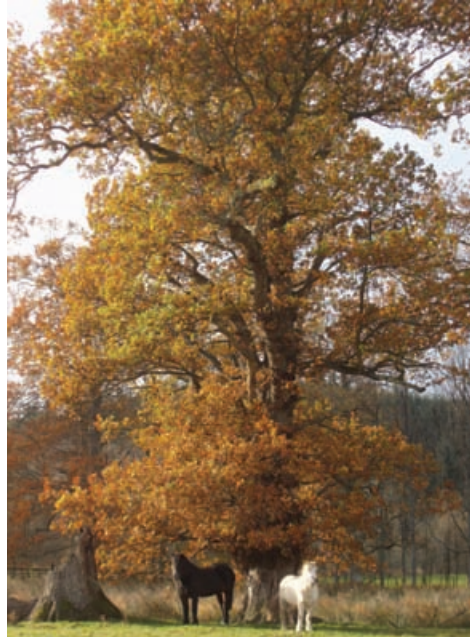
Seann darach aig Traquair, Crìochan na h-Alba

A thaobh fiath-bheathaichean is glèidhteachas nàdair, bheir iad seachad àrainn bheartach, agus dh'fhaodadh iad a bhith nan stòras de chraobhan, phreasan agus stuthan planntachaidh annasach.