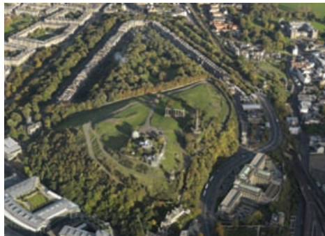
Cnoc Challtann, pàirt de Ghàradh a' Bhaile Ùir, Dùn Èideann