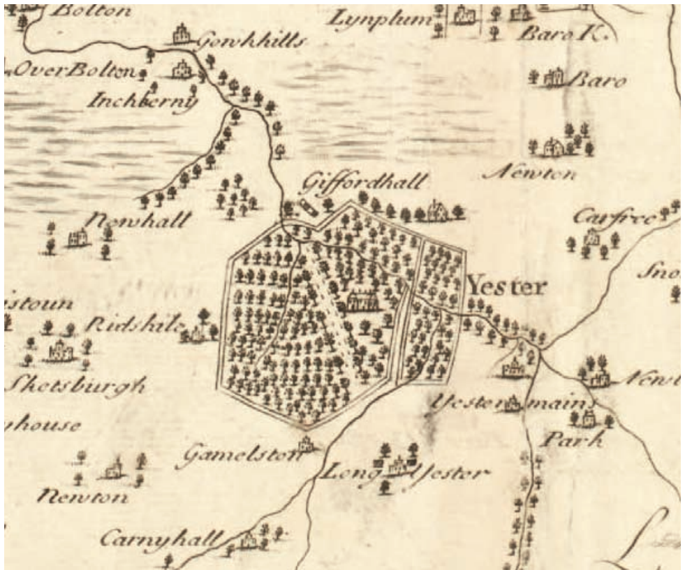
Mion-fhiosrachadh bho 'Mapa Lodainn an Ear, sgrùdaichte le J. Adair 1736'

Cuiridh Alba Aosmhor fàilte air fiosrachadh eachdraidheil a bharrachd is urrainn fhaighinn bho shealbhadair, manaidsearan-fearainn, ùghdarrasan ionadail agus goireasan ionadail no comainn eachdraidh.