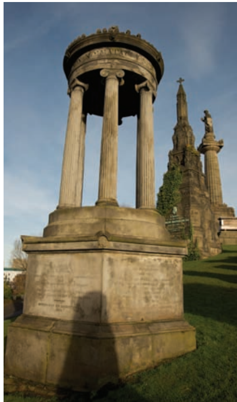
An Necropolis, Glaschu

Ann an 2008, chur sinn prògram ath-sgrùdaidh air bhog gus ath-mheasadh agus ùrachadh a dhèanamh air a' Chunntas. Aig an àm seo, tha 386 làraichean Cunntais ann an Alba (Dàmhair 2010). Mar a thig an Cunntas air adhart, bidh an àireamh seo ag atharrachadh mar a chuirear làraichean ùra ris agus feadhainn eile gan toirt air falbh.