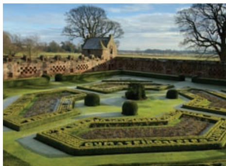
Gàradh balla Caisteal Edzell, Machair Aonghais

A thaobh cùisean co-cheangailte ri cùram is cumail suas thogalaichean agus structaran eachdraidheil, is urrainn do Bhuidheann Glèidhteachais Alba Aosmhor stiùireadh a thoirt seachad, agus bidh iad a' cur a-mach foillseachaidhean do gach cuid proifeasantaich is don phobail. Cur fios chun sgioba air 0131 668 8668, post-d hs.technicalconservationgroup@scotland.gsi.gov.uk , www.historic-scotland.gov.uk/index/heritage/conservation