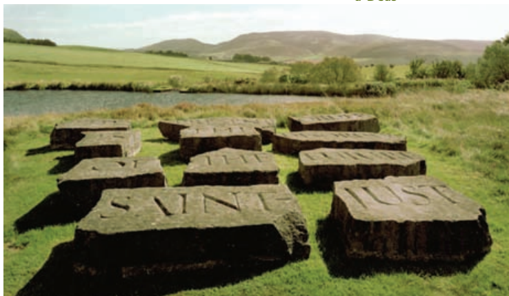
Little Sparta, Siorrachd Lannraig a-Deas