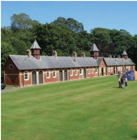
Ionad Easaig aig Taigh Haddo, Siorrachd Obar Dheathain

Mhinistearan na h-Alba, le rianachd bho Alba Aosmhor. Gheibhear tuilleadh fiosrachaidh a thaobh carraighean clàraichte agus a' phròiseas ceadachaidh bho làrach-lìn Alba Aosmhor aig www.historic-scotland.gov.uk/index/heritage/searchmonuments