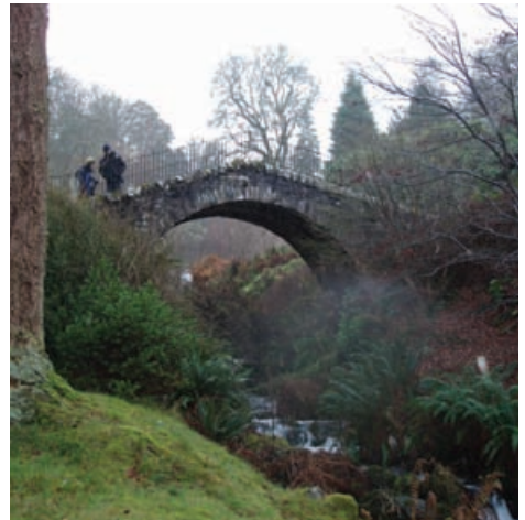
Gàraidhean Luidheanach Dawyck, Crìochan na h-Alba