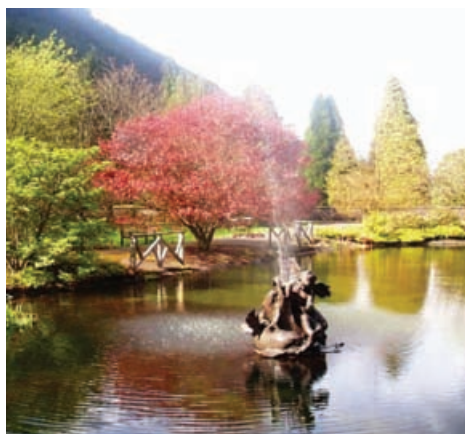
Gàraidhean Luidheanach na Beinne Mòra, Earra-Ghàidheal is Bhòid

Faodar gàraidhean agus seallaidhean-tìre dealbhaichte fa-leth taobh a-muigh sgìrean an ath-sgrùdaidh a mholadh airson an gabhail a-steach aig uair sam bith (faic d.9). Ach, bidh Alba Aosmhor mar as trice a' roghnachadh gun a bhith a' cur làrach air adhart ma tha e air ainmeachadh ann am prìomh thagraidh dealbhaidh beò.