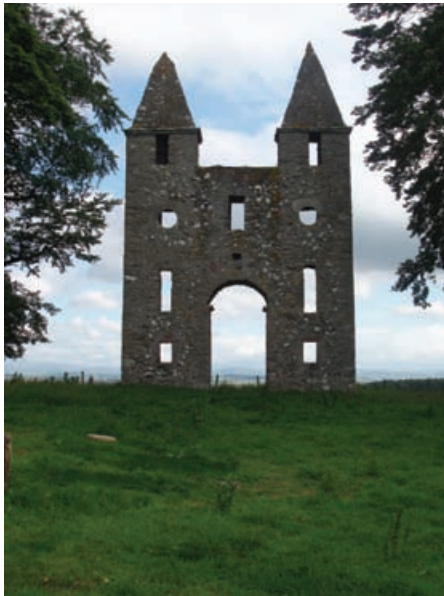
An amaideachd Hundy Mundy, Mellerstain, Crichean na h-Alba

Is e cinn farsaing a tha an sin agus tha prionnsapalan taghaidh air an làn-mhineachadh ann am Pàipear-taice 4 ann am Poileasaidh Àrainneachd Ministearan na h-Alba (Iuchar 2009) ri fhaighinn bho làrach-lìn Alba Aosmhor. Tha iad a' toirt seachad frèam-obrach far a bheil breith phroifeasanta ga nochdadh ann a bhith a' tighinn gu co-dhùnaidhean fa-leth.