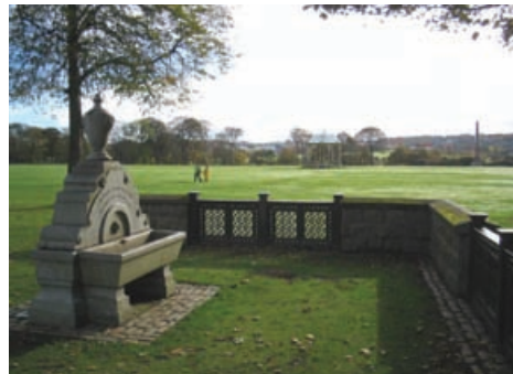
Pàirce Duthie, Obar Dheathain