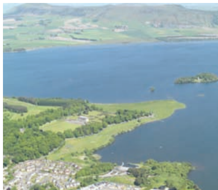
Sealladh adhair de Thaigh Chinn Rois, Peairt agus Ceann Rois