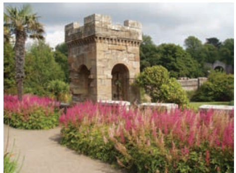
Staidhre Gazebo, Caisteal Culzean, Siorrachd Air a-Deas