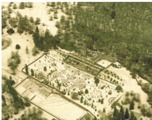
Sealladh gearmhraidh de ghàraidhean Caisteal Drummond, Peairt agus Ceann Rois

UK Climate Impacts Programme 'Gardening in the Global Greenhouse. The impacts of climate change on gardens in the UK' (2002) aig www.ukcip.org.uk/index.php